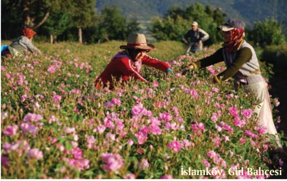
İslamköy Gül Bahçesi

Seleukeia'nın Bizans döneminde Agrai (Atabey) ile aynı piskoposluğa bağlandığı kayıtlardan anlaşılmaktadır.