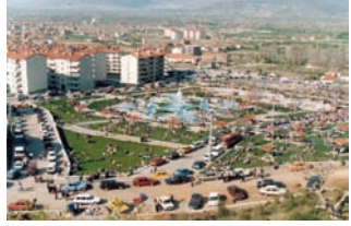
* Ayazmana Mesireliđi

Ayazmana Mesireliđi Merkez İlçe'nin 2 km güneydoğusunda bulunmaktadır. Soğuk suları ile ünlü dinlenme yeri kestane ağaçlarıyla kaplıdır. Piknik ve çocuk oyun alanları için tüm altyapı düzenlemeleri yapılmıştır.