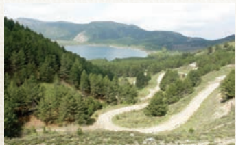
* Gölcük Gölü Tabiat Parkı

Isparta'ya 10 km.lik bir asfalt yolla bađlı olan Milas Mesireliđi, soğuk suları ve dođal güzellikleri ile ünlüdür. Milas Mesireliđi'nin hemen 500 m üstünde bulunan Gölcük Gölü Tabiat Parkı, eşsiz güzellikleriyle bir dođa harikasıdır. Tabiat parkı, Isparta ve yöre halkının gününbirlik dinlenme, eğlenme ve spor ihtiyaçlarını karşılayan bir tabiat harikası olarak, özelliđini yıllardan beri korumaktadır.