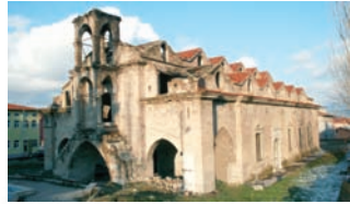
* Aya Ishotya (Yorgi)