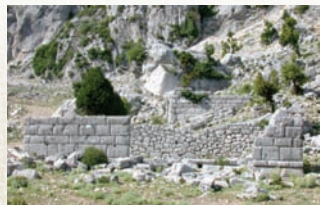
* Kapıkaya Harabesi

Eđimli arazide yer alan kentin gney tarafı surla evrili, kuzey tarafında ise yksek bir kayalık bulunmaktadır. Kent muhtemelen Hellenistik Dnemde (M 330-30) kurulmuřtur.