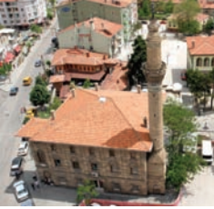
* İplikçi (Hacı Abdi) Camii