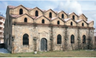
* Aya Baniya (Aya Payana)

İl Merkezinde, 1750 yılında yapıldıđı tahmin edilen Aya Baniya (Aya Payana) ve 1857-1860 yılları arasında yapılmıř olan Aya Ishotya (Yorgi) adında iki adet Ortodoks kilisesi bulunmaktadır.