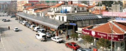
* Eski Üzüm Pazarı

Mimar Sinan Camisine gelir elde etmek için bedesten ile cami arasında 16 adet dükkân kövkedden ve ikişer katlı olarak yapılmıştır.