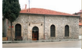
* Dalboyunođlu Hamamı

Dalboyunođlu Hacı Mehmet Ađa tarafından 1689-1693 yılları arasında yaptırılmıřtır. Isparta'daki hamamların en byđ ve en nemlisidir.