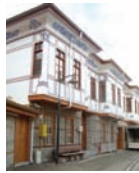
Eski Isparta evlerinden rnekler