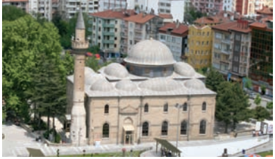
* Kutlubey (Ulu) Camii