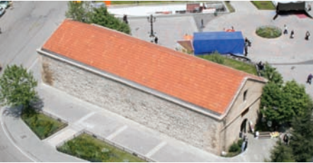
* Firdevs Bey Bedesteni

Kanuni Sultan Süleyman döneminde, Isparta Valisi Firdevs Bey tarafından, 1561 yılında, Mimar Sinan Camisine gelir sağlamak amacıyla yaptırılmıştır.